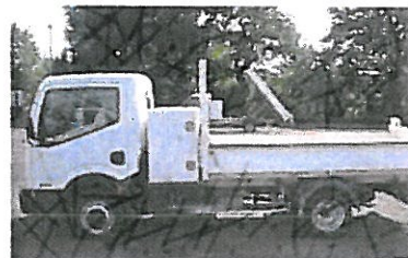
Camion benne NISSAN - 2009 68 000 km - 13 990 € HT