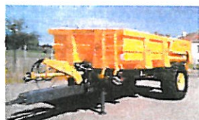
Remorque TP 11 T - 15 500 € HT

Pour le financement imprévu de ce nouveau matériel, un prêt de 46 000 €, correspondant au coût total HT, a été contracté à un taux de 1 % sur 5 ans.