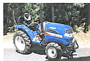
Tracteur ISEKI 4 RM Lame neige - 16 690 € HT