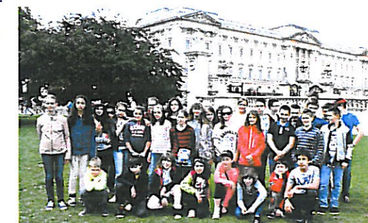
Voyage en Angleterre pour les 6 ème - 5 ème

La liaison avec les écoles primaires s'est constituée au sein du Conseil « Ecoles-Collège ». L'Association Sportive du Collège et le Sport Scolaire Primaire ont beaucoup travaillé ensemble : les cycles « Natation » et « Ski » ont regroupé par exemple les élèves du Collège et ceux du CM2 de la Vallée. De plus, le 19 juin, les élèves de CM2 ont passé la journée au Collège.