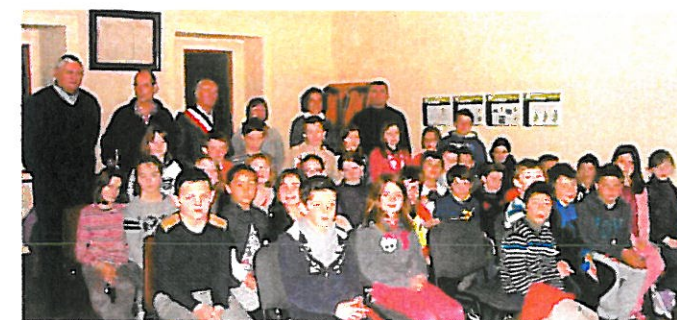
Visite de la Mairie pour les CE2 - CM1 - CM2

Le mode de fonctionnement des TAP (Temps d'activités périscolaires), gérés par la Communauté de Communes, reste inchangé. Horaires : mardi et vendredi de 15 h 00 à 16 h 30.